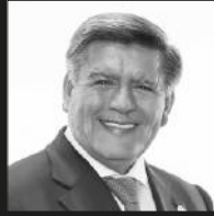
Dr. César Acuña Peralta FUNDADOR